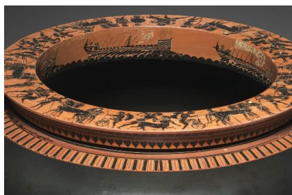
Fig. 5. Cleveland (SHBA). Piktori Antimenes