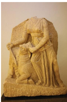
Fig. 7. Nikja Apoloni

një shpatë dhe me të majtën mban brirët e kafshës gati për kurban (simbol i fitores) 27 . Kjo skenë me ndikim dhe bukuri të fortë gjendet e ekspozuar në muze të ndryshme evropiane. Shfaqet gjithashtu edhe në objekte, si në statujën dhe vazon të ekspozuara në Muzeun Kombëtar të Kopenhagenit në Danimarkë 28 ; në pasqyrë, gdhendje, në Muzeun Arkeologjik të Athinës (fig. 8) 29 ; në atë të Budapestit - Szépművészeti Muzeu; në unazën e Muzeut Hermitage në Rusi; në Muzeun Britanik (fig. 9) në statujat romake (kopje e grekëve ) 30 . Rëndësia e kësaj skulpture shihet edhe në pikturën: Jan De Bisschop – 1628 – 1671, Holandez (fig. 10). Skulptura e Apolonisë është një nga shembujt për të përmirësuar trashëgiminë kulturore shqiptare. Mbi të gjitha nëpërmjet kërkimit shkencor dhe krijimit të itinerareve, ekspozitave që kalojnë përmes bashkëpunimit të institucioneve dhe muzeve të ndryshme shqiptare dhe evropiane. Ky element është pikërisht një nga ata që mund ta bëjnë të flasë trashëgiminë artistike shqiptare.