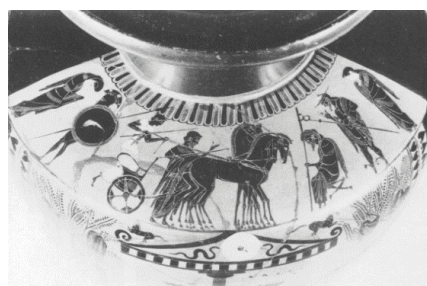
Fig. 6. Leidenit. Holanda. Piktori Antimenes