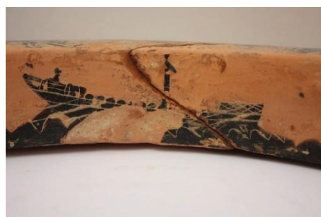
Fig. 4b. Skena e buzëzës. Piktori Antimenes.