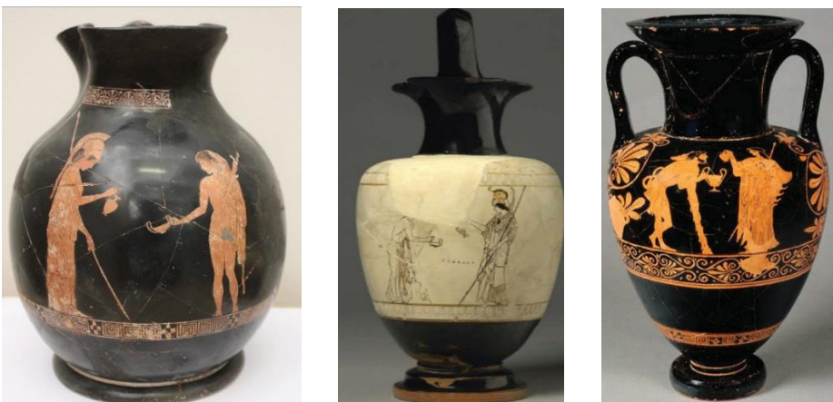
Fig.1. Herakliu me Athinën: Muzeu Arkeologjik Durrës, Muzeu Britanik, Muzeu i Luvrit

Skenat e paraqitura në qeramikën me figurë të kuqe, krijojnë ato lidhjet kulturore, si për shembull veprat e mjeshtrit të Brygosit 11 , të cilat shfaqin perëndeshën Athinën dhe heroin Herakliun, në një pamje rinore, me lëkurën e luanit 12 . Të njëjtën skenë e gjejmë të ekspozuar në Muzeun Britanik, (pjesë të zbuluara në qytetin antik etrusk të Vulcit që i atribuohet piktorit D 14 13 ), si edhe në amforën me figurë të kuqe të ekspozuar në Muzeun e Luvrit (fig.1) 14 .