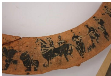
Fig. 4a. Dinos - Durrës. Piktori Antimenes.

nxjerr në pah nevojën sesi trashëgimia arkeologjike shqiptare duhet të jetë objekt i kërkimit të kujdesshëm shkencor, por edhe krijues i itinerareve kulturore midis muzeve dhe institucioneve shkencore, që në këtë rast shohin: Durrësin, Madridin, Adrian (Itali), Cleveland-in, Luvrin - Paris (Francë) dhe Holandën.