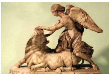
Fig. 9. Muzeu Britanik, Londër.