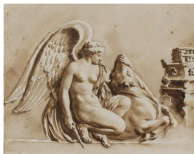
Fig. 10. Nikja me demin (Jan De Bisschop)