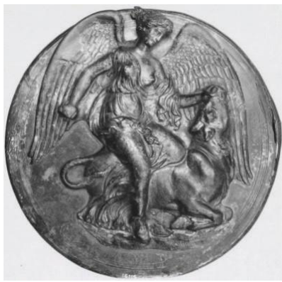
Fig. 8. Nikja Muzeu Arkeologjik i Athinës