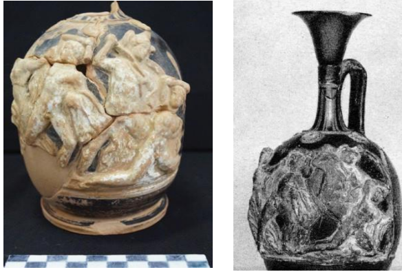
Fig. 3. Lekitos – Muzeu Arkeologjik Durrës, Muzeu i Arteve të Bukura në Bruksel

dokumentuar binjaku i tij i ekspozuar në Muzeun e Arteve të Bukura në Bruksel (fig.3.) 20 .